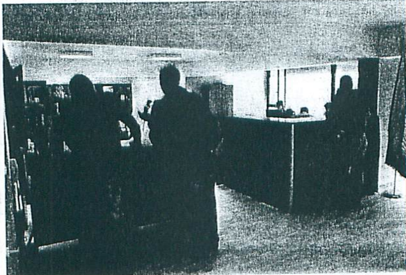
Tras el acto de inauguración comenzó la actividad cotidiana del Consulado, que desde primeras horas de la mañana recibió a numerosos ciudadanos venezolanos para tramitar sus documentos.

Del mismo modo, a partir de mañana, se pondrá en marcha un nuevo sistema de atención al público que conlleva que diariamente se atiendan a 50 personas