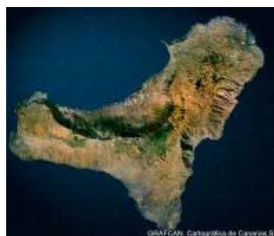
Los datos de deformación del terreno, registrados "no perceptibles a las personas", confirman un nuevo proceso que está reflejando la reciente actividad sísmica anómala

Desde el INVOLCAN se recuerda que la información oficial sobre el nivel de alerta ante fenómenos volcanológicos adversos es la que se emite a través de los comunicados del Plan Especial de Protección Civil y Atención de Emergencias por Riesgo Volcánico en la Comunidad Autónoma de Canarias (PEVOLCA).