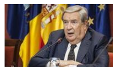
El obispo de Tenerife prohíbe una misa de la Logia de Jerónimo Saavedra en memoria a los masones fallecidos

Jennifer Jiménez - Santa Cruz de La Palma