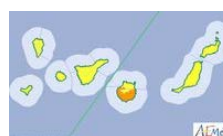
Activan el aviso de riesgo en La Palma por altas temperaturas este lunes

Esther R. Medina - Santa Cruz de La Palma