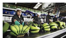
Récord histórico en la producción de plátano en Canarias “en un escenario muy negativo para la venta”