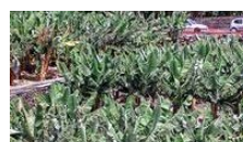
Marcha de protesta en la capital de los agricultores del plátano para exigir una renta digna