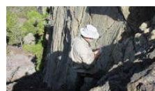
Estudian las fallas que favorecen el ascenso del magma en una futura erupción volcánica

Esther R. Medina - Santa Cruz de La Palma