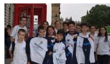
La Palma Ahora - Santa Cruz de La Palma

Cartográfica de Canarias “es la entidad responsable de llevar a cabo las actividades de planificación, producción, explotación, difusión y mantenimiento de información geográfica y territorial de Canarias conforme a las directrices y política geográfica del Gobierno de Canarias”. Se trata de “un servicio especializado del Ejecutivo canario que se constituyó como sociedad anónima por unos principios de eficacia técnica y agilidad administrativa”.