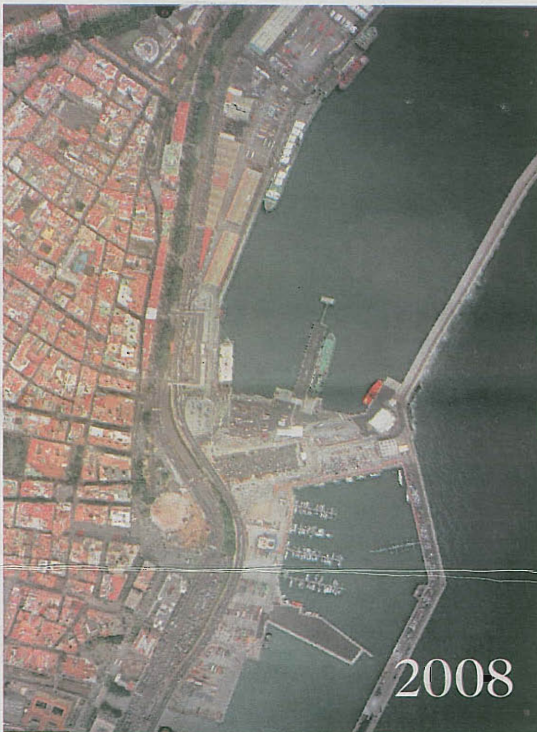
Zona baja de la ciudad de Santa Cruz de Tenerife, con la única alterada de la plaza de España, zona que en la imagen de 2008 no se percibe tan claramente como antaño debido a la construcción de la plaza y la fuente conocida como géiser. La capital tinerfeña recuperó el litoral sin hipotecar sus playas, como sucedió en Las Palmas de Gran Canaria.

Para 2012 la UE exige la creación de mapas donde se detalle distribución de especies, zonas de ruido o áreas contaminadas