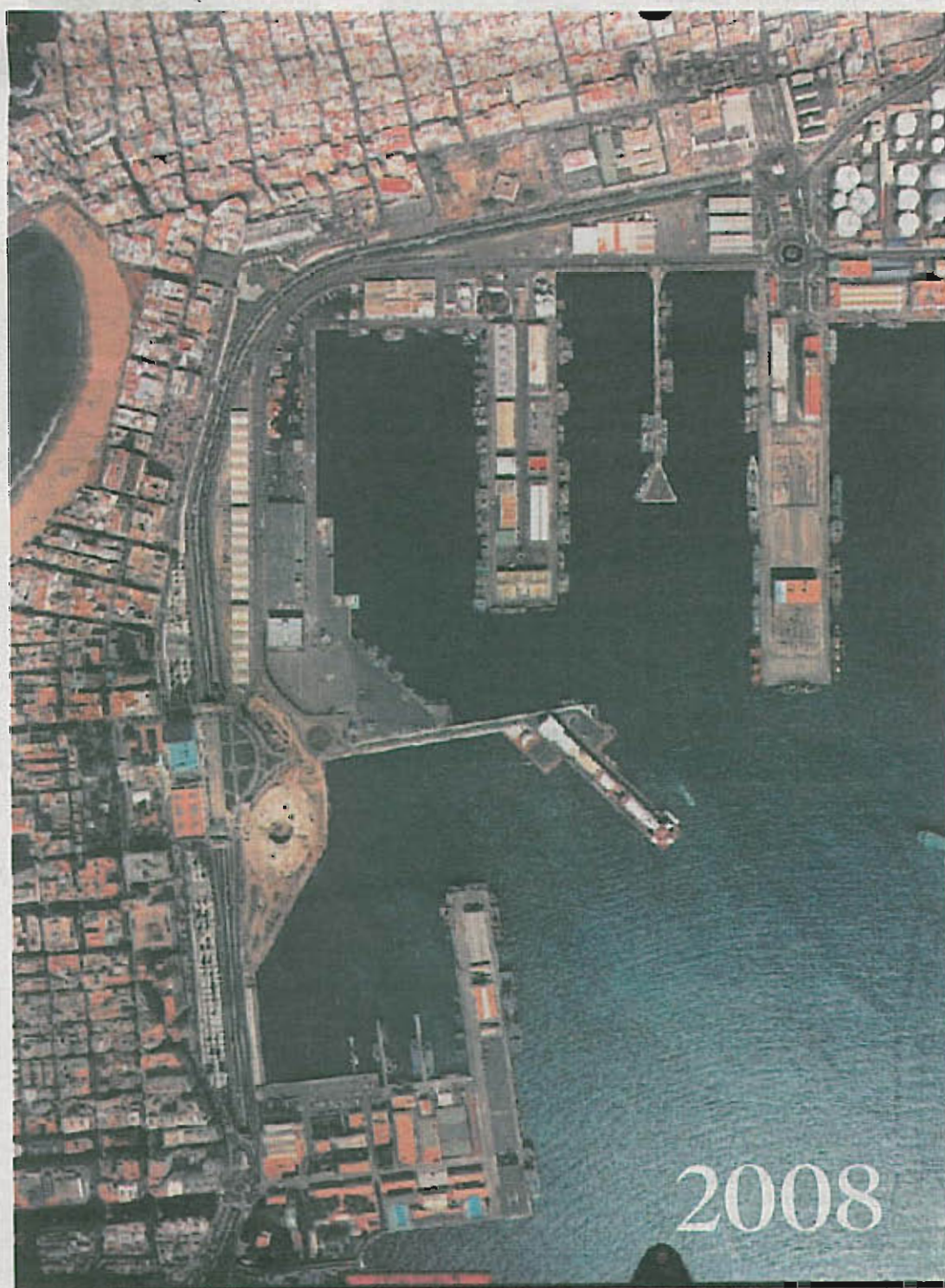
Secuencia de imágenes históricas de la zona portuaria de Las Palmas de Gran Canaria. Sin duda, constituyen el más claro ejemplo del desarrollo de la ciudad entre los años sesenta y la actualidad. El crecimiento del Puerto y sus muelles, si bien fue el motor de la capital, también se puede apreciar que hipotecó el futuro capitalino.