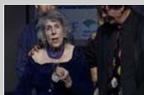
Muere María Isbert a los 94 años