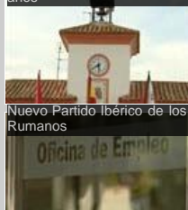
Nuevo Partido Ibérico de los Rumanos